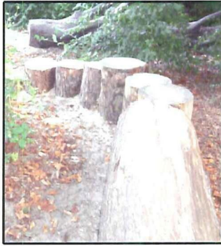
(B) boomstam + (C) boomschijven